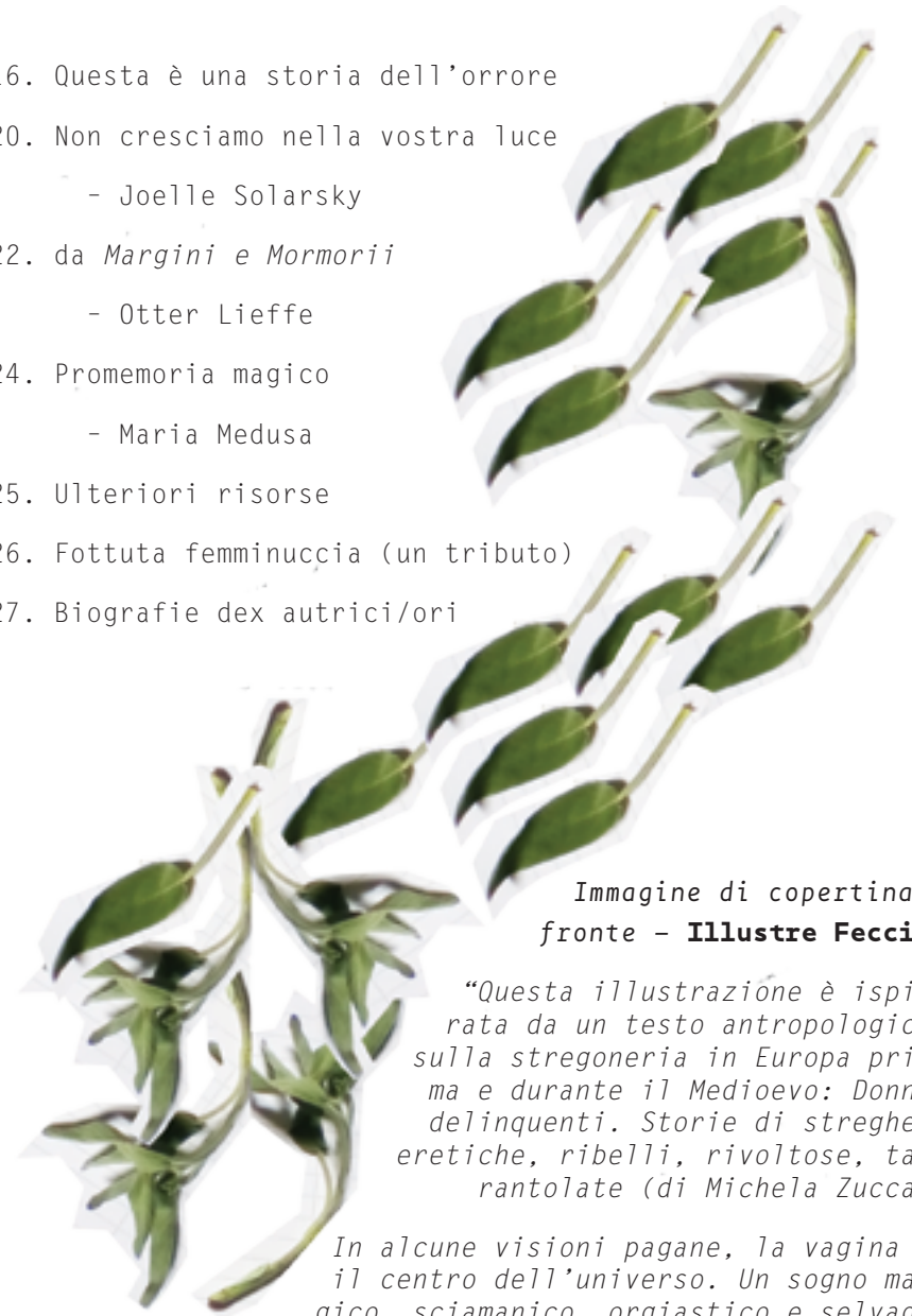
Immagine di copertina: fronte - Illustre Feccia

“Questa illustrazione è ispirata da un testo antropologico sulla stregoneria in Europa prima e durante il Medioevo: Donne delinquenti. Storie di streghe, eretiche, ribelli, rivoltose, tarantolate (di Michela Zucca)