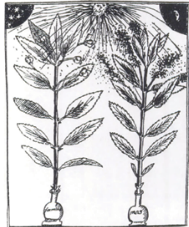
FIG 13. “L’amore attacca anche le erbe”: relazioni sessuali tra una pianta femmina (sinistra) e una maschio (destra) nell’opera di Linnaeus Praeludia sponaliorum plantarum (1729) in Smarre Skrifter af Carl von Linné , ed. N.H. Larjungar

pendentemente al servizio della scienza”. Raccolse osservazioni su piante e animali, sebbene “si limitò a presentare le sue osservazioni, lasciando la classificazione ai suoi colleghi uomini.”